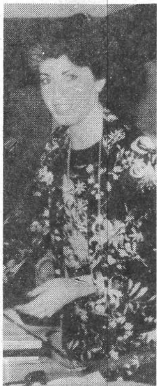
Adriana Poli Bortone

Penso — ha affermato l'on. Poli Bortone — soprattutto ai giovani, ai guasti che la cosiddetta civiltà dell'immagine ha prodotto su una generazione che veste, si comporta, si muove secondo cliché sempre uguali. Ma che, per fortuna, comincia a dare segni di insofferenza che noi dobbiamo essere pronti a raccogliere, nel nome dell'essere contro l'essere, nel nome di quel profondo rispetto della dignità dell'uomo che è la parte più vera delle nostre radici.